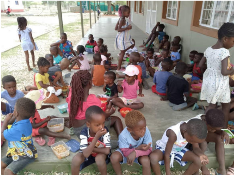
Lunchen in de schaduw